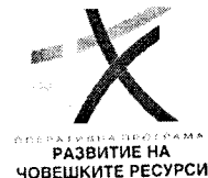
Схема за предоставяне на безвъзмездна помощ BG05M9OP001-2.002 „Независим живот“ Проект № BG05M9OP001-2.002-0213-C001 „Достоен живот за хора в неравностойно положение в Община Свиленград“

чл.26. (1) ИЗПЪЛНИТЕЛЯТ носи отговорност за предприемане на нерегламентиран достъп до информационните активи в Община Свиленград, както и ако застраши сигурността на същите в размер на 30% от договореното възнаграждение.